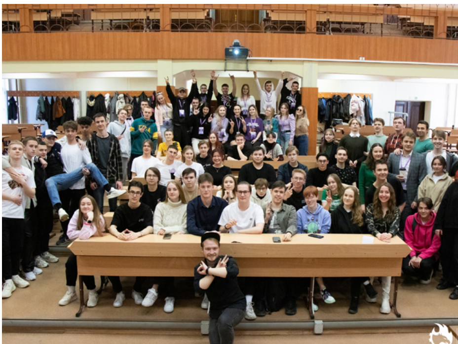
Авторы: Дыгай Александра, Данил Рогушкин

Я сам был участником 2 раза, на 3 раз стал директором мероприятия. Конечно, хотелось бы повторить, если бы это было как в первый раз, когда ты ещё мало знаком с деятельностью профбюро, только все узнаешь. Но сейчас интереснее быть организатором и делать всё возможное, чтобы участки получали только положительные эмоции.